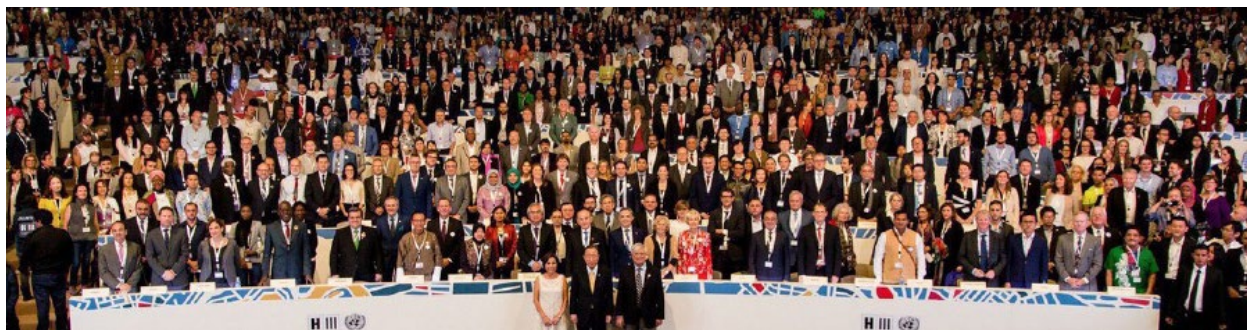
Aprobación Nueva Agenda Urbana en Habitat III, Ecuador, 2016.

La Nueva Agenda Urbana (NAU) recoge el enfoque planteado por el Programa de Naciones Unidas para los Asentamientos Humanos (ONU-Habitat). La “Vivienda en el Centro de la NAU”, que pone la vivienda en el centro de las agendas locales y nacionales, integrándolo dentro de los marcos y las estrategias nacionales de desarrollo.